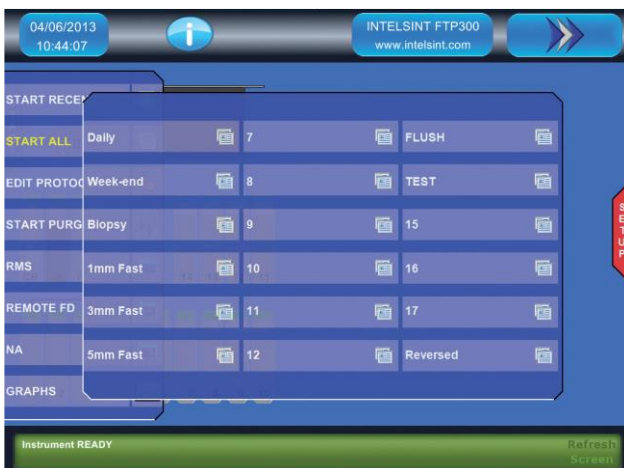
Hauptmenü mit Standardprogrammen und der Übersicht auf die prozessbegleitenden Parameter

In der Version FTP-300 eines der schnellsten Nicht-Mikrowellengerät am Markt. Bis zu 300 Biopsien können mit handelsüblichen Medien in nur 40 Minuten sicher entwässert und paraffinfiltriert werden.