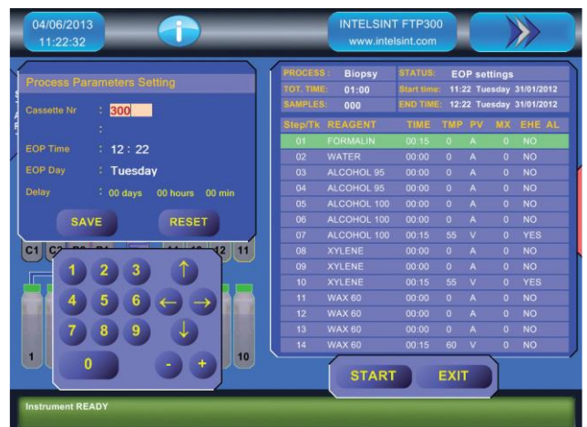
Prozessmenü mit der Anzeige aller Parameter während das Programm läuft