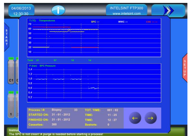
Servicemenü für die Parameterkontrolle